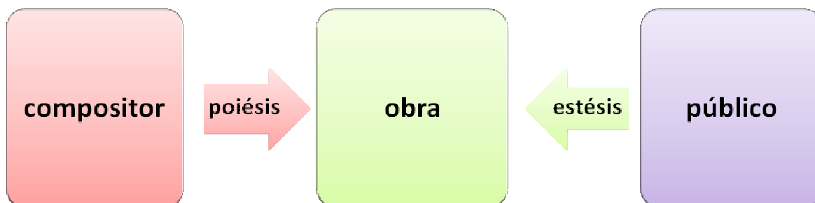
Figura 2: ESQUEMA COMUNICAÇÃO MUSICAL NATTIEZ

memória de uma audição corresponde o nível neutro da obra musical (Nattiez, 1990, Monteiro, 1999).