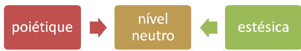
Figura 1: Modelo Tripartido de Nattiez

Desse modo, torna-se mais correto falarmos de trocas simbólicas, segundo o modelo semiológico de Jean-Jacques Nattiez (1990) denominado “modelo tripartido”, ao invés de um processo de comunicação emissor, receptor, mensagem (Nattiez, 1990). Podemos representá-lo assim: