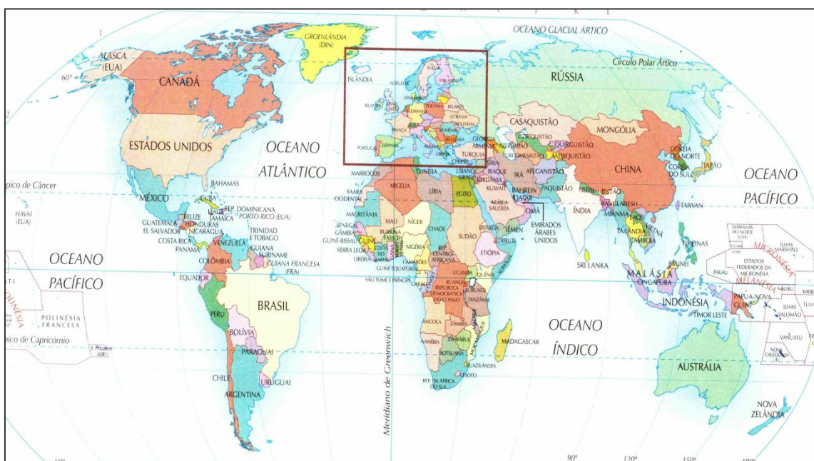
Figura 1 - Planisfério Político 1

Ao se observar o mapa mundi político (figura 1), é possível notar que praticamente toda a superfície das terras emersas está dividida em porções de territórios sob a jurisdição de algum Estado. Considerando a afirmação de SANTOS, D. (2007, p. 02), “ de que a cartografia que conhecemos é, como quaisquer outros produtos, historicamente datada e, nesse sentido, deve sempre ser vista como condição e limite, isto é, como condição para o desenvolvimento das ordenações territoriais tais como as conhecemos e, também, como limite para que possamos pensar novas e outras formas de organizarmos nossas vidas. ” Recordemos que essa imagem do planisfério político é amplamente utilizada em livros didáticos, artigos de revistas e jornais e em todo tipo de mídia visual. E, portanto, a primeira noção que as pessoas têm da superfície terrestre é da sua divisão em Estados e, obviamente, da existência de tais Estados.