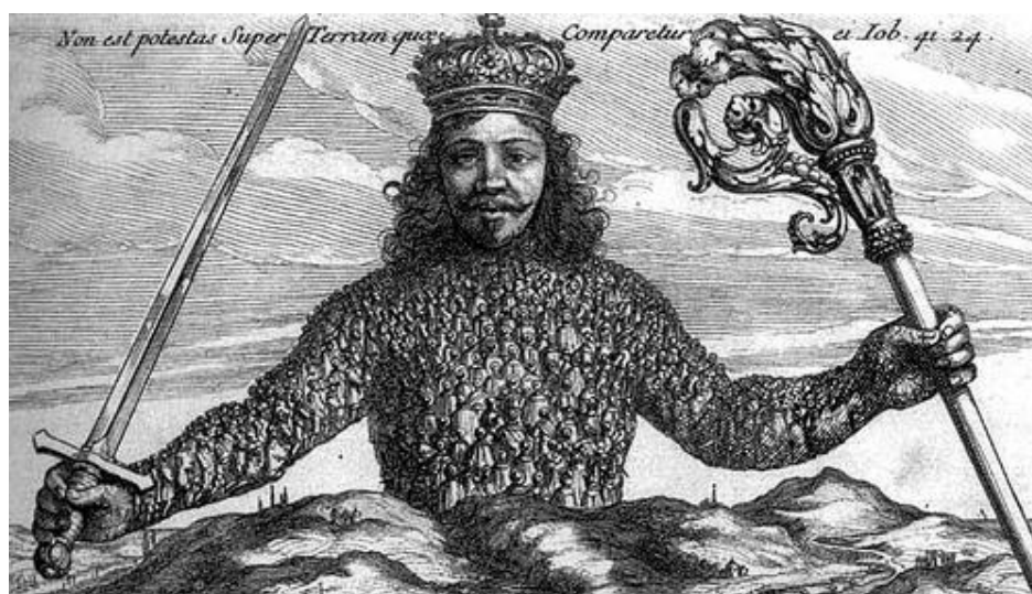
Figura 3 - Recorte da capa da 1ª edição do Leviatã. 4

homens de uma determinada sociedade, como pode ser observado na figura 3, e cuja definição de soberania está expressa na citação a seguir.