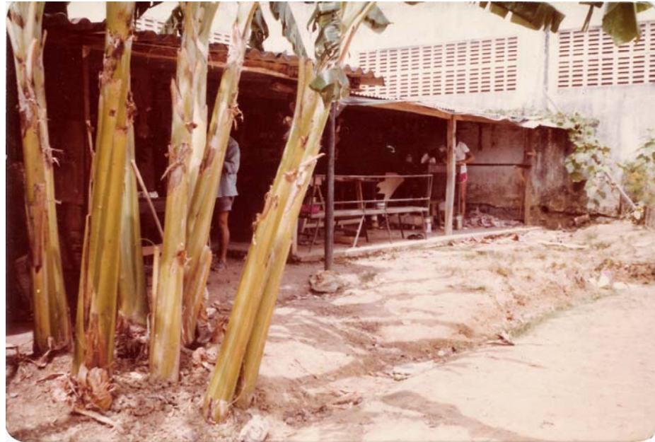
Imagem 15: Vista panorâmica do galpão de artesanato dos presos políticos na Penit. Barreto Campelo. S/data.