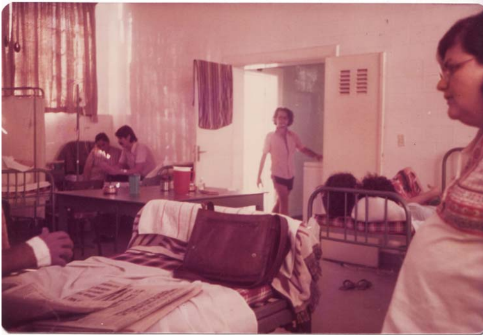
Imagem 31: Visita aos presos políticos no Hospital Militar de Pernambuco, durante greve de fome de 1978. S/d.