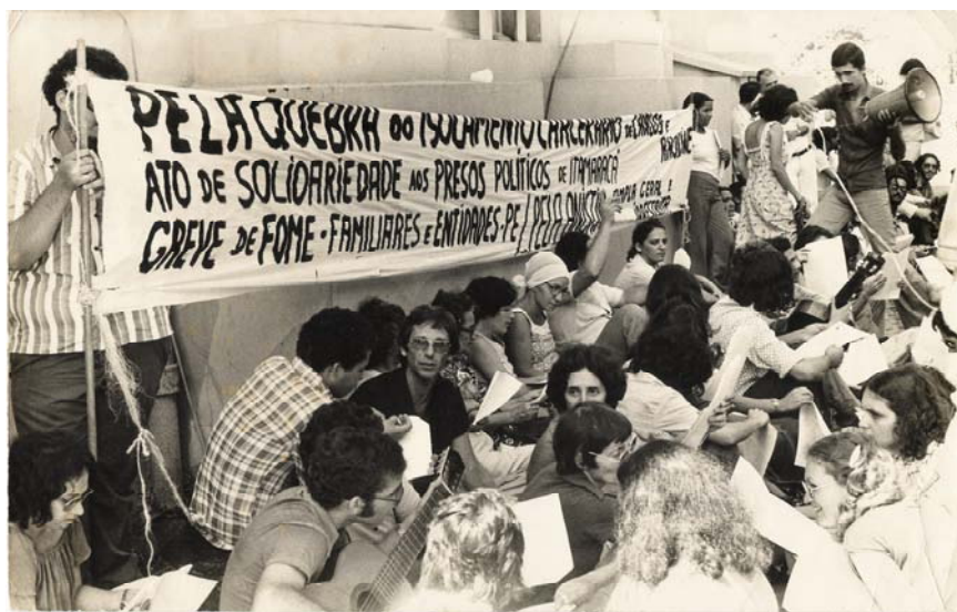
Imagem 36: Ato de Solidariedade aos presos políticos de Itamaracá. Recife-PE. 04/05/1978.

A maneira como os presos políticos de Itamaracá aparecem na imagem 34 nos permite ponderar uma mudança na composição do quadro: até 1978, o coletivo não registra no ato fotográfico dentro do cárcere outras figuras que não sejam eles mesmos ou, no máximo, seus familiares durante as visitas. Na primeira fotografia apresentada acima, o detalhe de mãos de prováveis repórteres ouvindo e escrevendo em blocos nos passa a sensação de que, pela