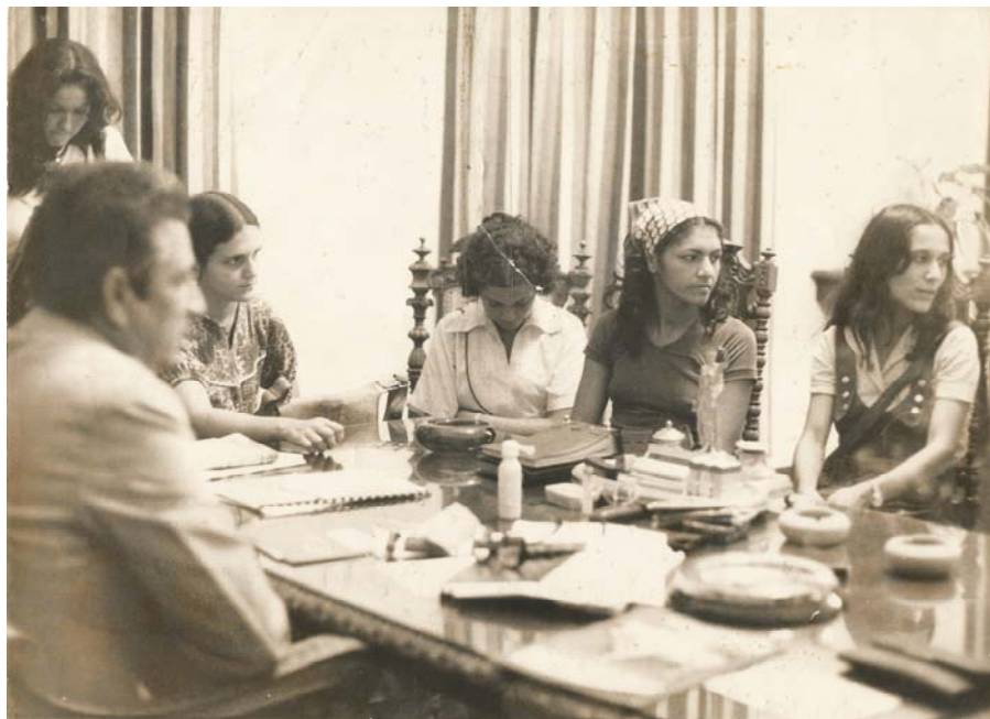
Imagem 33: Familiares dos presos políticos com o Governador de Pernambuco Moura Cavalcanti. Greve de Fome Nacional. 27/04/1978. Acervo: Marcelo Mário de Melo.

Das cinco imagens apresentadas acima, somente as duas primeiras (n os 29 e 30) foram registradas na Penitenciária Barreto Campelo. Não há como declarar certeza se aquelas saias sentadas, na imagem 29, são fotografadas pelos próprios presos políticos ou por alguma delas. O fato é que posam e, se posam, deixam exposta a intenção de serem alcançadas por uma câmera – e câmera amiga -, afinal, ninguém ousaria demonstrar sorriso a qualquer funcionário de ambiente carcerário tão hostil. Um olhar cauteloso detido ainda na imagem 29 nos permite observar outro indício dessa mediação: sacolas, pacotes, bacias, caixas e uma garrafa térmica aparecem postas no chão, o que parece ser um indicativo de que ali não havia uma estrutura adequada para recebê-las.