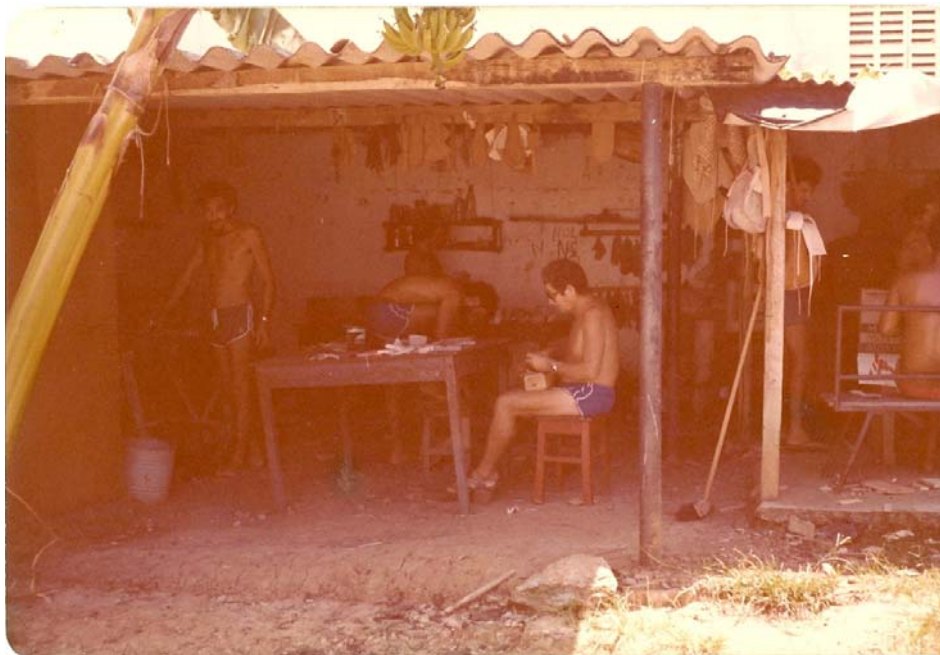
Imagem 16: Vista do galpão de artesanato. S/data.