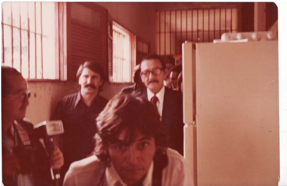
Imagem 40: Visita do senador Teotônio Vilela a Penitenciária Barreto Campelo. 18/07/1979.