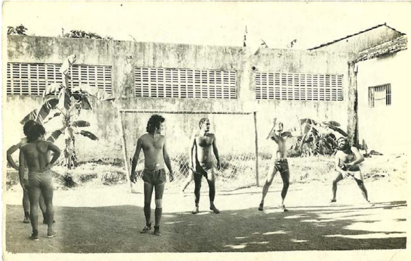
Imagem 13: Presos políticos jogando futebol na Penit. Barreto Campelo. Nov/1978.

artesanato são citados recorrentemente como atividades que consolidam a rotina e a resistência do coletivo de Itamaracá. E essa constância também vai percorrer, como foi visto, a coleção fotográfica dos ex-presos políticos da Barreto Campelo. Conhecer e estudar mais duas imagens deste lote temático possibilita acrescentar perspectivas.