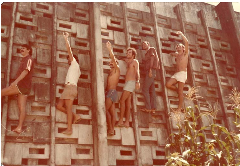
Imagem 46: Os que ficam se despedem dos que vão. 1979. Pátio externo do pavilhão de presos políticos da Barreto Campelo.