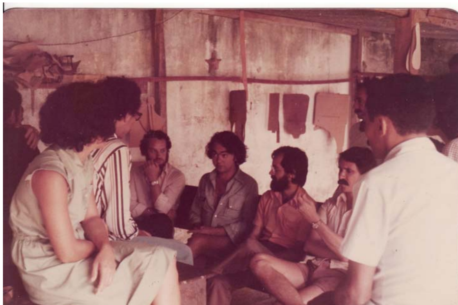
Imagem 44: Reunião com representantes do Movimento de Anistia. Balcão de artesanato da Penit. Barreto Campelo. Jul/Ago 1979.

É a primeira vez, desde que começam a se fotografar no cotidiano na Barreto Campelo, que os presos políticos registram cenas como a das fotografias 39/40. Não há registro de que antes eles haviam focado a câmera para o corredor interno do pavilhão, tampouco enquadrado uma imagem onde as grades que os isolavam do restante da penitenciária aparecessem abertas para dar passagem à comitiva tão numerosa. Captam a chegada dos senadores Teotônio Vilela e Marcos Freire. Registram também os gestos simbólicos de apoio, as mãos parlamentares nos ombros de um preso político.