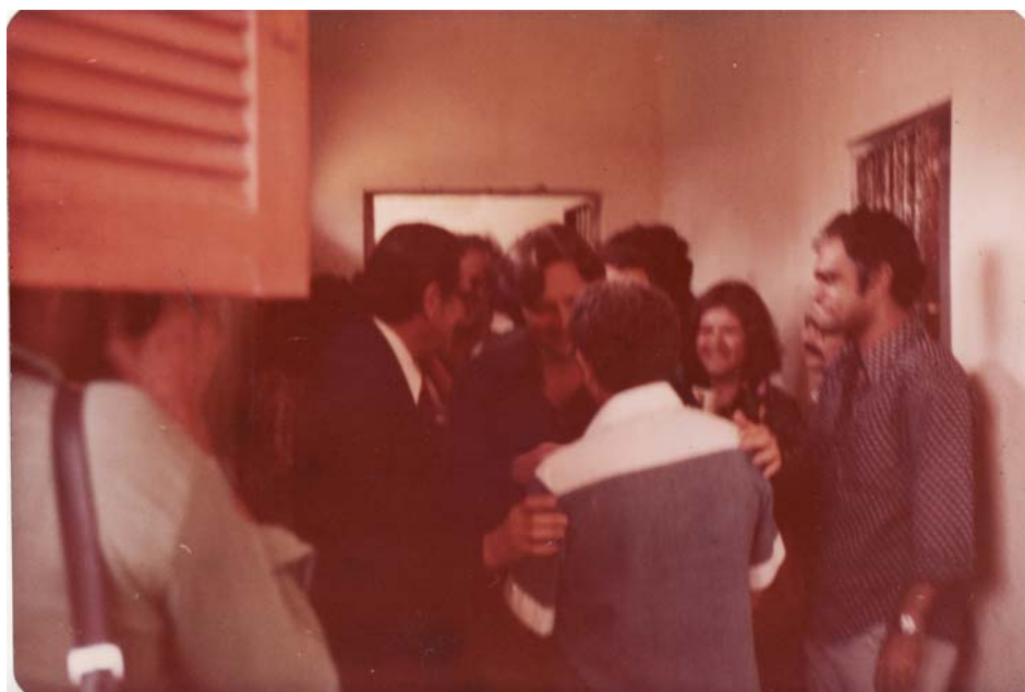
Imagem 39: Os senadores Teotônio Vilela (paletó escuro) e Marcos Freire em visita ao pavilhão dos presos políticos da Barreto Campelo. 18/07/1979.

Se nos detivermos no acervo fotográfico dos ex-presos políticos, poderemos encontrar outros modos de compreender a representatividade das mudanças trazidas pela peregrinação da Comissão de Anistia a Itamaracá. Entre julho e agosto de 1979, durante a Greve de Fome por Anistia Ampla Geral e Irrestrita, os representantes das caravanas nacionais invadem os cárceres, atravessam as grades e encampam, pessoalmente, a campanha a favor de liberdade no espaço onde, por longo período, a ditadura manteve seus opositores inacessíveis. Todo esse processo de abertura política por dentro das celas vai ser flagrado e acompanhado por uma construção imagética feita pelos próprios prisioneiros políticos da Barreto Campelo.