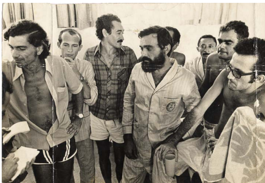
Imagem 34: Presos políticos em entrevista, logo após o fim da greve de fome. Hospital da Polícia Militar do Recife. Maio de 1978.

No repertório iconográfico encontrado no acervo pessoal dos ex-presos políticos de Itamaracá também é possível desvendar vestígios do poder de alcance da greve de fome nacional de 1978, traduzidos nas intenções de representações imagéticas que os integrantes do coletivo procuravam destacar ao se fotografarem.