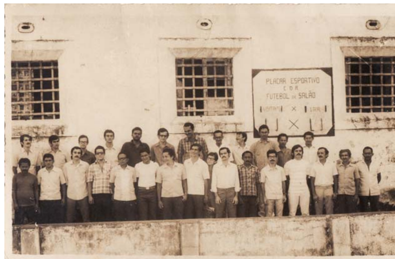
Imagem 2 – Os 29 presos políticos da Casa de Detenção do Recife, em agosto de 1971.