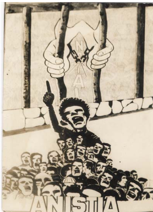
Imagem 37: Cartão de Ano Novo enviado pelos presos políticos da Bahia aos de Pernambuco. Dez/1978.