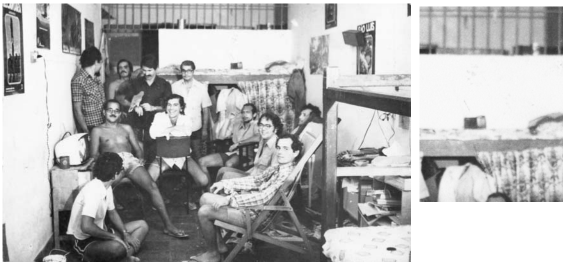
Imagem 28: Presos políticos em uma das celas da Penit. Barreto Campelo. S/d.

Nas imagens 25, 26 e 27, o som do violão participa e resiste nas visitas familiares, no convívio no coletivo, no espaço íntimo da cela. Na primeira imagem, é quase canção de ninar. Na segunda (imagem 26), a postura é de quem o aponta como uma arma, um parabellum na mão. Na fotografia 27, entre quartinha d'água, latas de leite ninho guardadas na prateleira, jornal no chão e material de papel enrolado embaixo da mesa, o violão parece aninhar a solidão e compor a intimidade do canto do preso político, no espaço restrito da cela.