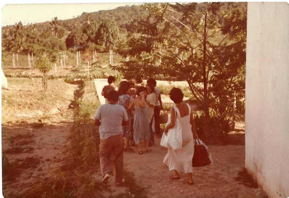
Imagem 30: Saída das visitas da Penit. Barreto Campelo. S/d.