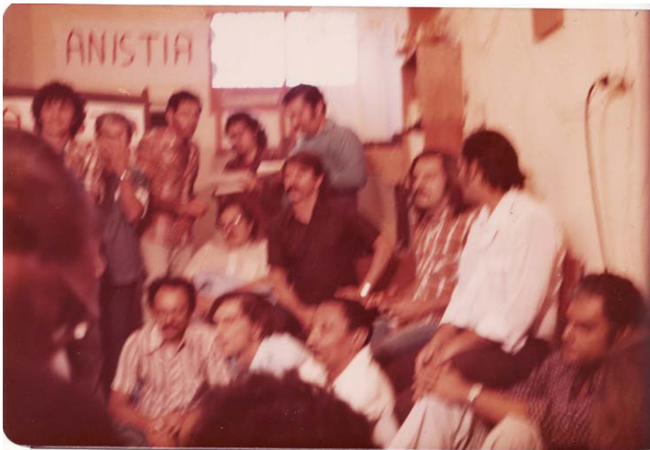
Imagem 43: Presos políticos de Itamaracá reunidos em uma das celas com representantes da Comissão da Anistia. Jul/1979.