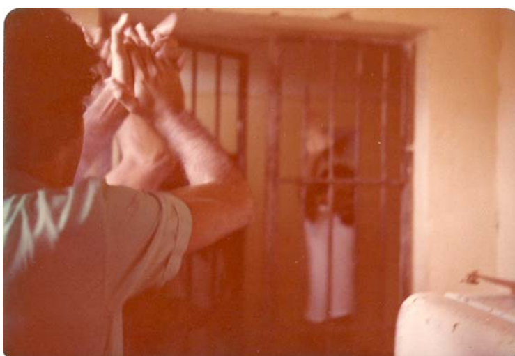
Imagem 47: Saída de Alanir Cardoso. 03/04/1979.