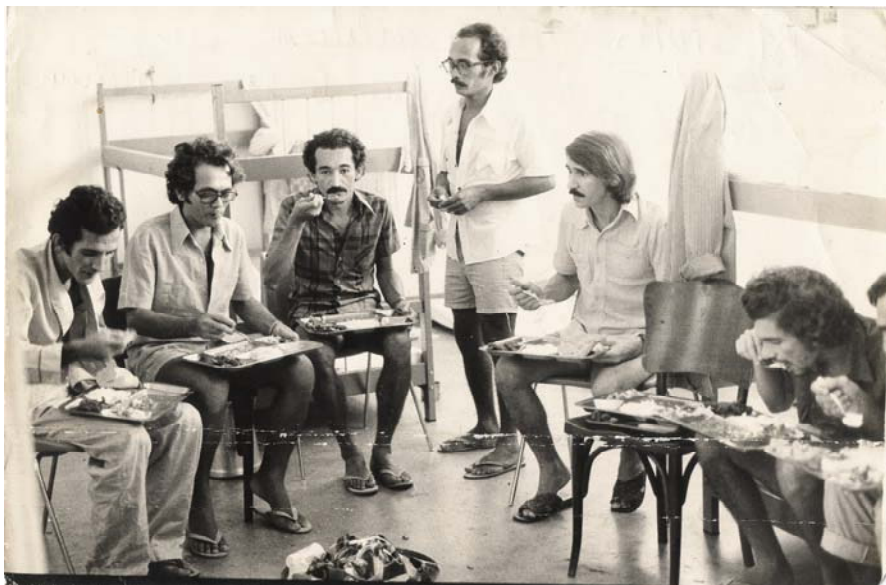
Imagem 35: Primeira refeição após 23 dias de greve de fome. Hospital da Polícia Militar de Recife, maio de 1978.