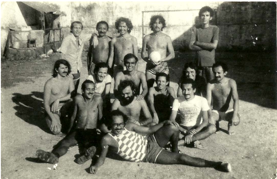
Imagem 9: Presos políticos no campo de futebol da Barreto Campelo. Julho de 1978.

O peso da representatividade deste tema na experiência da prisão política revelou-se também quando parti para o levantamento do acervo fotográfico. Em todos os álbuns dos entrevistados, a maior incidência de fotografias são justamente aquelas que retratam os presos políticos formando um time de futebol após uma partida ou exercitando os corpos em jogo no campinho do pavilhão.