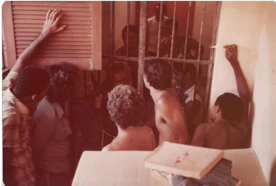
Imagem 42: Visita de frei Damião aos presos de Itamaracá. Jul/Ago 1979