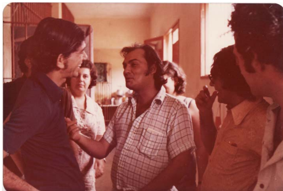
Imagem 41: Presos políticos da Barreto Campelo conversam com o deputado Roberto Freire. Jul/Ago 1979.