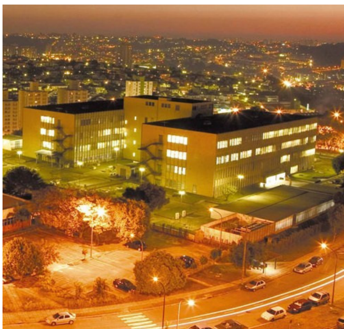
Figura 2 - Foto Aérea do Hospital Universitário da USP

Seu espaço físico compreende: 5 consultórios de Triagem, 13 consultórios de Pronto Atendimento, 11 leitos de Observação em Pronto Atendimento Adulto, 12 leitos de Observação em Pediatria, 02 leitos de Observação em Obstetrícia; 8 salas de Centro Cirúrgico, 4 salas de Centro Obstétrico; 7 leitos de Recuperação Pós-Anestésica; 10 leitos de Hospital Dia; 235 leitos para internação (em serviços de Pediatria, Clínica Médica, Obstetrícia, Ginecologia, Cirurgia Geral, Ortopedia, Berçário), 14 leitos de Unidade de Terapia Intensiva Adulta, 6 leitos de Terapia Intensiva Pediátrica e 5 Neonatal; 57 consultórios de Atendimento Ambulatorial; salas para o Programa de Assistência Domiciliária (PAD) e para o Programa de Oxigenoterapia Domiciliar (POD); 17 salas de aula, 5 anfiteatros, creche para os filhos dos funcionários e área de lazer para a confraternização dos funcionários do Hospital.