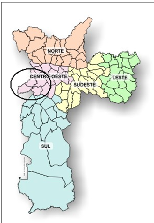
Figura 1- Mapa do Município de São Paulo

O Hospital Universitário está localizado na Cidade Universitária, Zona Oeste da cidade de São Paulo e se insere geograficamente no Distrito de Saúde Butantã.