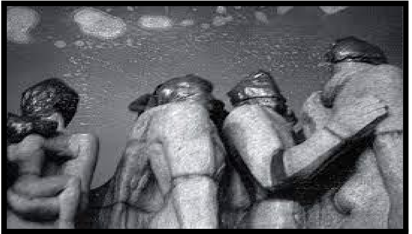
Figura 7. Ensacamento do Monumento às Bandeiras, 1979.