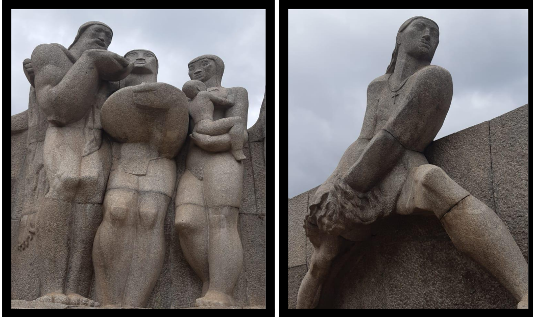
Figura 2. Português e indígenas, segurando um Balaio e um bebê, Detalhes do Monumento às Bandeiras, Victor Brecheret, Foto de Reserva pessoal (2021)

A obra traz consigo a representação da miscigenação, na figura da mãe indígena que segura um bebê em seus braços, adjunto da representação da extração do ouro, figura de um homem branco ao lado de um indígena que segura o balaio, instrumento utilizado na extração aurífera.