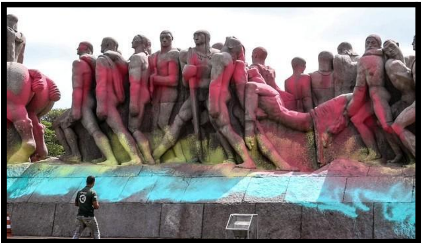
Figura 8. Monumento às Bandeiras coberto de tinta.