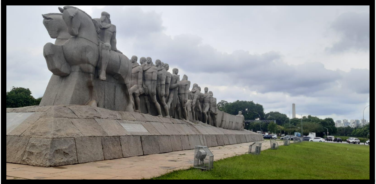
Figura 1. Foto frontal do Monumento às Bandeiras, Victor Brecheret, Foto de Reserva Pessoal (2021).

manutenção da elite cafeeira que se beneficiou com as bandeiras e que se diziam descendentes diretos dos desbravadores, elaborando assim uma memória nacional confortável a eles. Revitalizando a imagem bandeirante e trazendo o regionalismo nacional paulista pautado no ideal de modernidade, marca do próprio centenário.