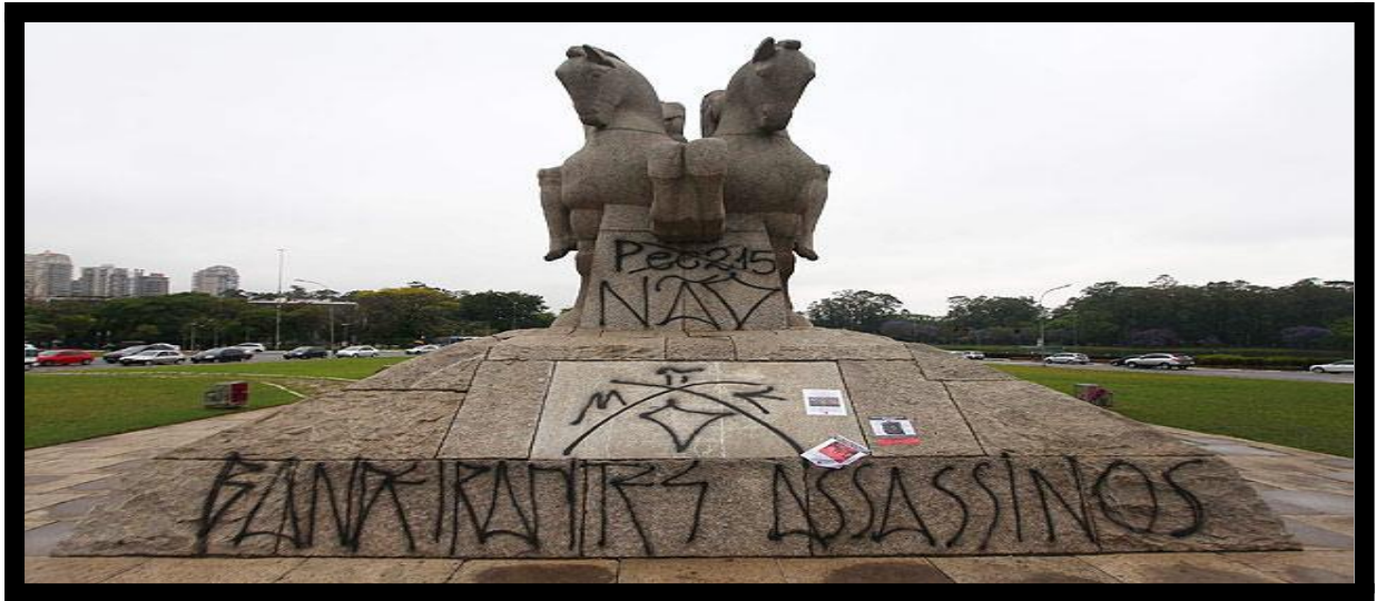
Figura 6. Pixo Manifesto (2013), Foto Estadão (03/10/2013)

Durante outros anos, a obra recebeu intervenções de menor repercussão em relação às anteriormente citadas, sendo elas: “O ensacamento ao Monumento às Bandeiras” de 1979 que fazia alusão à prática de grande recorrência durante os interrogatórios realizados durante a ditadura militar (1964-1985), em que as cabeças dos presos políticos eram cobertas com sacos, induzindo ao sufocamento. Tal intervenção foi realizada pelo grupo 3NÓS3 2526 , conhecido por suas ações que questionavam os espaços públicos da cidade paulista, sendo essa a primeira intervenção política no monumento.