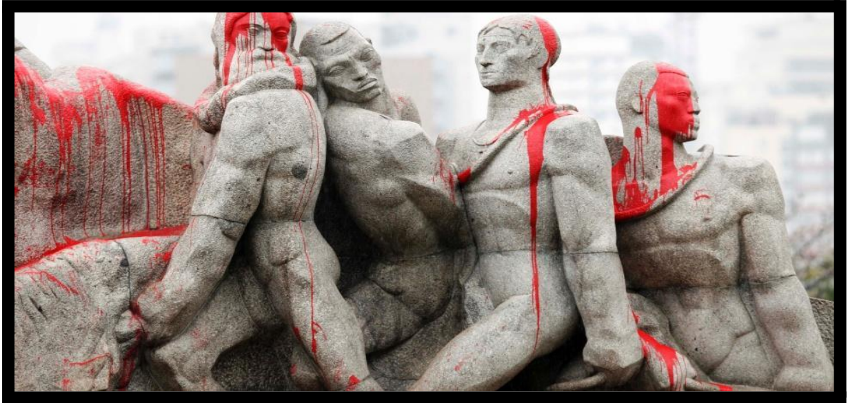
Figura 5. Sangramento do Monumento às Bandeiras (2013)

indígena derramado pelos “heróis” bandeirantes, alguns apoiadores da pauta indígena jogaram tinta vermelha nas figuras de granito. O filho de Victor Brecheret, aproveitou para dizer que seu pai sempre teve orgulho da solidez de sua obra e dizia que mesmo que caísse uma bomba em São Paulo, o monumento permaneceria intacto 21 . Porém, naquele dia o “Monumento às Bandeiras” sangrou.