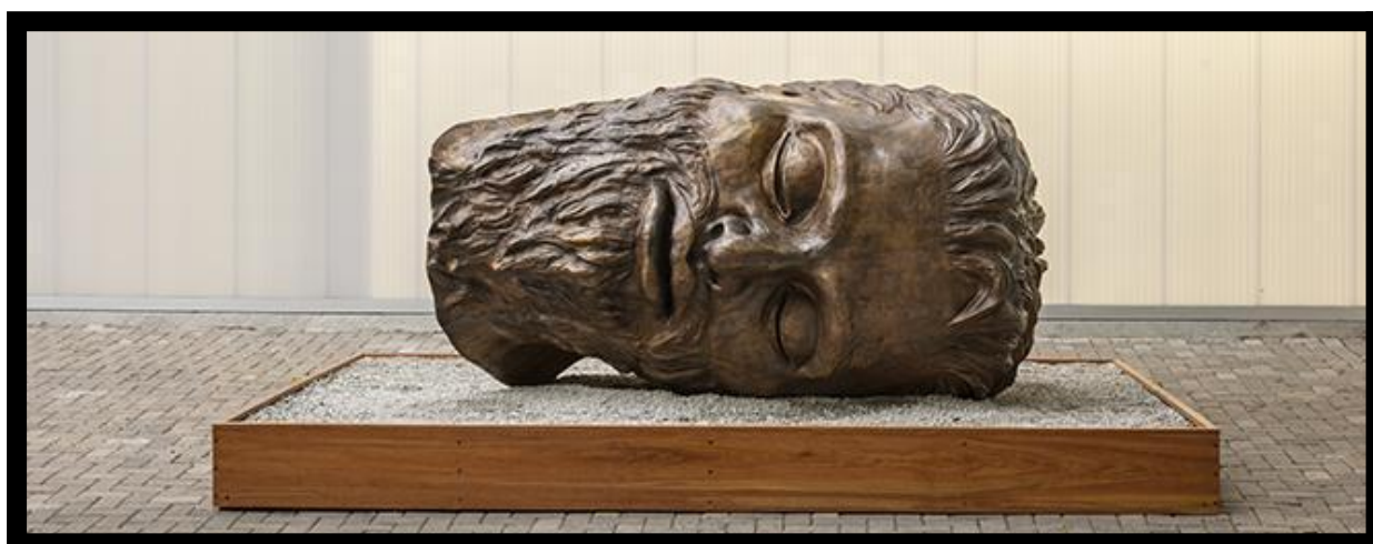
Figura 9. Tinha que acontecer; Cabeça bandeirante, Flávio Cerqueira, 2016, Bronze, 135 x 250 x 160 cm, Foto de Romulo Fialdini

“Seria um sonho se esse trabalho fosse instalado ao lado do Monumento às bandeiras, [...] acredito que esse contraponto poderia colocar em questão a presença heroica dos bandeirantes em nossa história e a minha ideia de anulação simbólica desses heróis se concretizaria de fato” 28 .