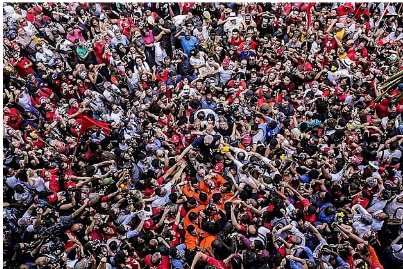
Apoiadores na saída de Lula da cadeia.

Em agosto do mesmo ano aconteceram as reportagens investigativas do site “The Intercept Brasil”, que revelaram mensagens trocadas entre integrantes da operação Lava Jato, onde fica claro a relação entre o ministério público e Sérgio Moro. A falta de um julgamento justo e a ausência de provas se tornou evidente, e após 580 dias, Lula foi liberado.