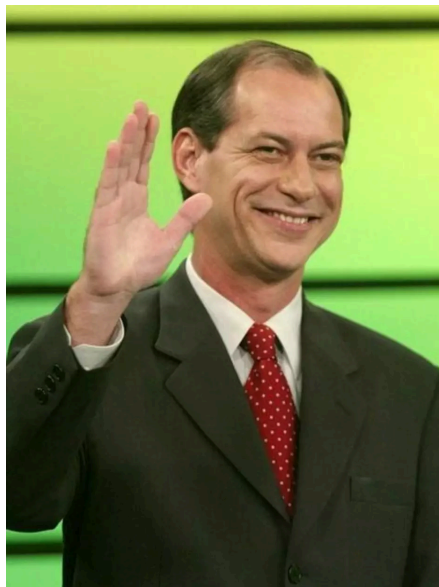
Ciro Gomes, acena ao chegar para último debate do primeiro turno da campanha

O emprego, e principalmente a falta dele, foi de fato um ponto central para praticamente todas as candidaturas. Para conquistar o eleitor, os candidatos prometiam um número de geração de novos empregos, exceto um deles: Ciro Gomes