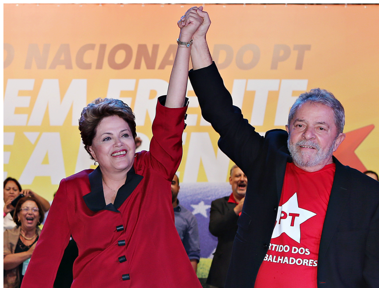
Lula e Dilma em 2014

Depois de 2010 Lula indicou sua sucessora, Dilma Rousseff, que teve dois mandatos enquanto presidente da república do Brasil. Se os governos Lula foram marcados por um contexto econômico favorável, com a baixa do dólar, o controle da inflação e o aumento do poder de compra da população, Dilma já enfrentou um cenário mais turbulento economicamente e com crises internacionais.