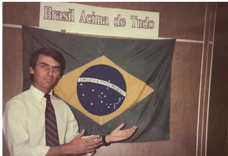
Jair Bolsonaro posa para foto com a bandeira do Brasil na frente de seu gabinete na Câmara dos Deputados

As suas declarações se destacavam por conta da ausência do seu trabalho enquanto Deputado, durante 28 anos apenas dois Projetos de Leis de sua autoria foram aprovados, ele nunca exerceu um papel de liderança nos partidos que fez parte e também nunca assumiu cargos no governo federal ou posições de destaque na Câmara. Sua popularidade acontecia através de seus posicionamentos, em especial os contra a comunidade LGBTQIA+ e a favor da Ditadura Militar, que garantiam exposição e atraíam para ele, milhares de apoiadores.