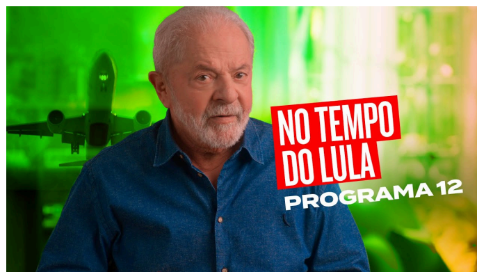
Peça publicitária “No tempo do Lula”

Para isso, as propostas foram adaptadas e Lula falava com frequência em temas importantes para essa parcela do eleitorado, como: aumento do salário mínimo acima da inflação, propostas para endividamento, atualização da tabela do Imposto de Renda e soluções para os comerciantes e micro-empresários.