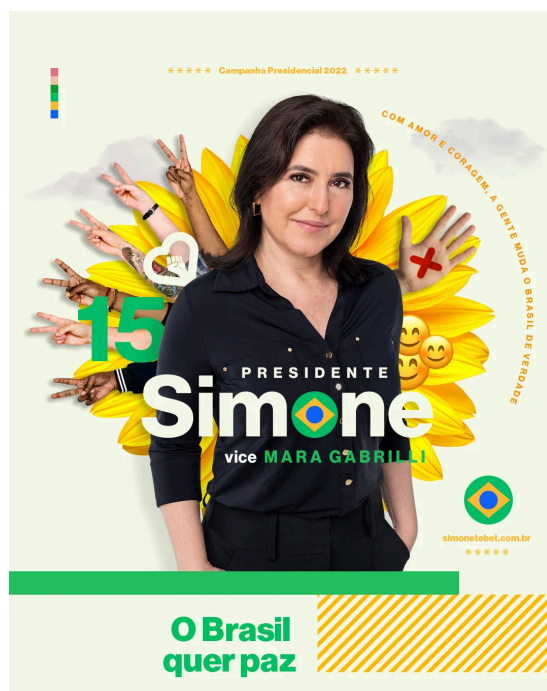
Simone Tebet, campanha política de 2022

A viabilização da sua candidatura foi conturbada e exigiu uma série de movimentações políticas internas. Além de precisar se apresentar para o Brasil, já que segundo pesquisa do DataFolha de maio de 2022, 70% dos eleitores afirmaram desconhecer a senadora, ela também precisava convencer os dirigentes partidários.