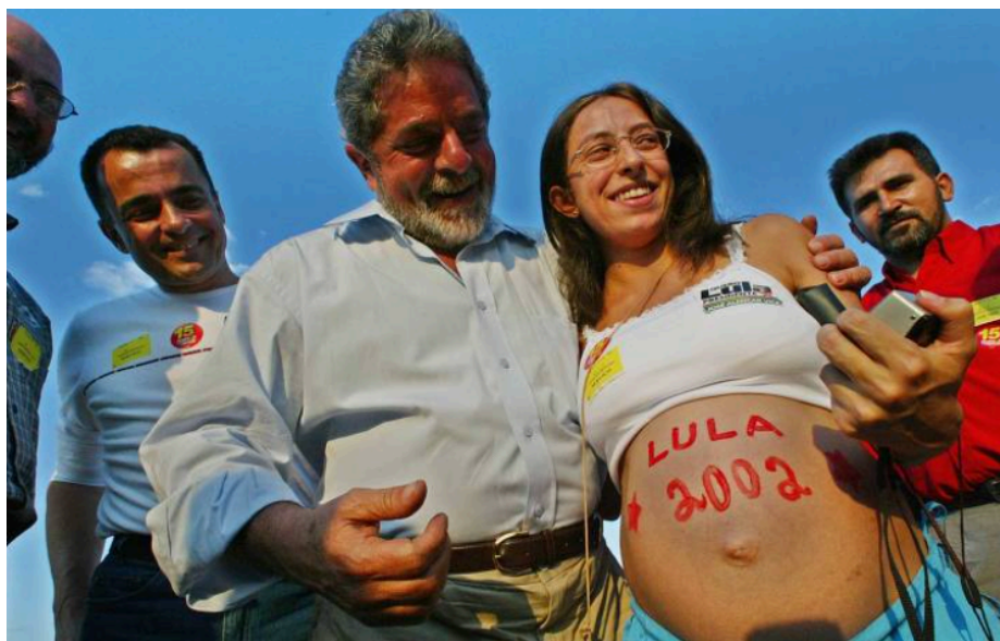
Lula faz campanha em Palmas (TO)

Em entrevista ao jornal O Globo antes da corrida eleitoral de 2002, Lula afirmou o seguinte: “Essa será minha primeira campanha profissional, quero ganhar esta eleição e não embarcarei mais nas loucuras anteriores”, outra afirmação feita neste sentido e que marcou sua candidatura aconteceu durante um evento em Manaus, ao falar sobre a disputa entre Ciro e Serra, ele afirmou: “O Lulinha não quer brigar, o Lulinha é paz e amor.”