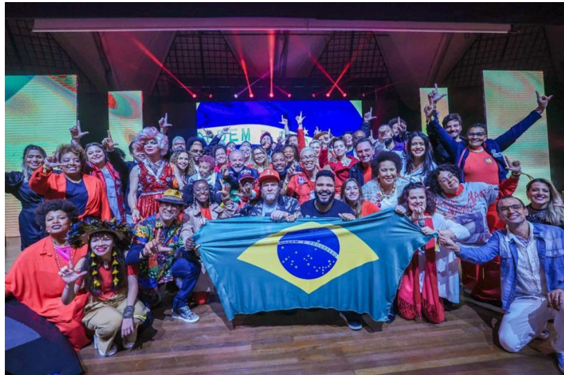
Artistas com Lula em 2022 - (Portal Metr poles)

Já no horário eleitoral em rádio e TV, a estratégia era relembrar os eleitores indecisos, dos “tempos de Lula”, principalmente falando sobre geração de emprego. Peça publicitária exibida em agosto de 2022, falava sobre o “Tempo do Lula”, comparando a diferença entre os valores do gás, gasolina e alimentação. Ao final da propaganda, o PT exibiu a nova gravação do jingle “Lula Lá”, que marcou a campanha de 2002 e ganhava uma nova versão, que também trazia o apoio massivo de artistas e intelectuais na campanha.