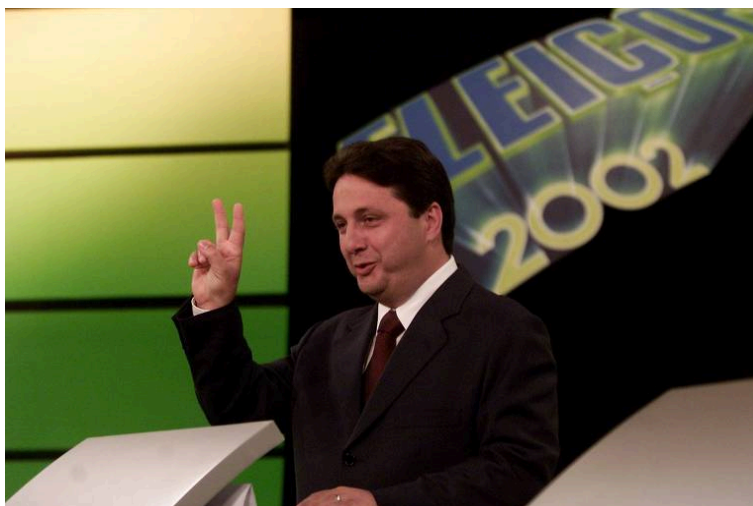
Garotinho durante gravação do último debate na TV antes do primeiro turno em 2002

Apesar do claro impacto da sua boa administração no Rio de Janeiro, colégio onde ele foi o candidato mais votado no 1º turno com 40%, a mobilização religiosa e especialmente evangélica foi fator determinante para a votação expressiva que Garotinho recebeu ao final daquela eleição.