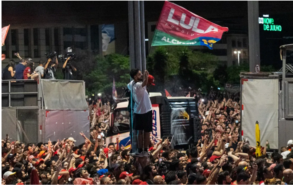
Comemoração da vitória de Lula na Av Paulista 2022

Assim, tanto as eleições de 2002 quanto as de 2022 foram marcos decisivos na história política do Brasil, cada uma representando uma ruptura com o sistema vigente e o início de um novo ciclo histórico. Esse "novo ciclo histórico" refere-se à transição para momentos políticos distintos, nos quais as escolhas feitas pelos eleitores resultaram em mudanças profundas na forma como o país seria governado, introduzindo novos projetos de sociedade, valores e prioridades políticas.