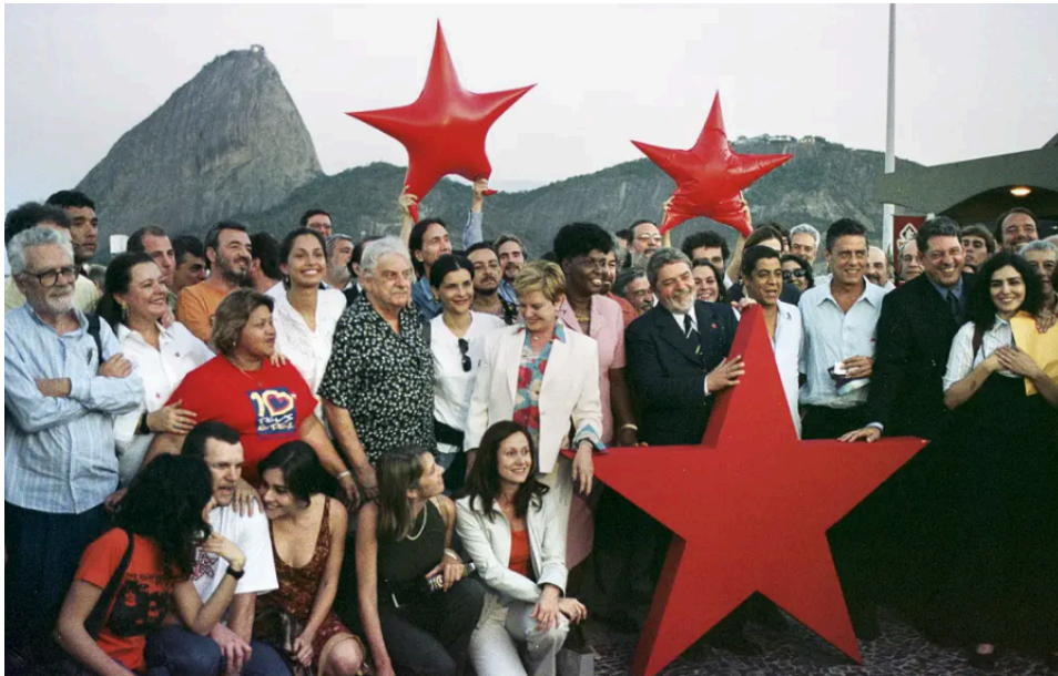
Lula com artistas, em 2002