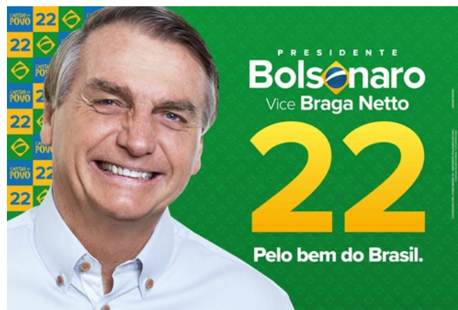
Jair Bolsonaro, campanha política de 2022

Em 2022, Bolsonaro precisava fazer o contrário, era importante mostrar para a população os seus feitos enquanto presidente e justificar que ele merecia mais quatro anos.