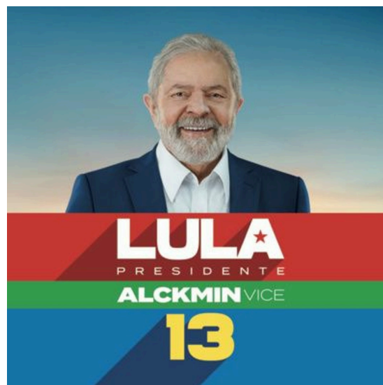
Lula campanha política de 2022

O seu plano de governo focava na retomada do crescimento econômico com justiça social, combate à fome e redução das desigualdades. Ele propunha revogar o teto de gastos, reformar o sistema tributário, revogar a reforma trabalhista de 2017 e criar novos direitos para trabalhadores informais. Também propunha a criação de políticas de proteção ao meio ambiente e iniciar a transição para uma economia verde, comprometendo-se com o combate ao desmatamento e a valorização dos povos indígenas. Além disso, seu plano de governo trazia destaque para políticas de fortalecimento da democracia, garantia dos direitos das minorias e promoção da igualdade de gênero e racial.