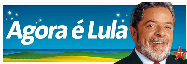
Lula campanha política de 2002

Para isso, Lula se utilizou da ideia de união. Deixou de ser o candidato da esquerda ou dos mais pobres e passou a ter o objetivo de representar a todos, deixando esse movimento claro não só em suas peças de campanha e em debates e eventos públicos, mas também em movimentos importantes, como a Carta ao Povo Brasileira e a escolha de José Alencar para seu vice.