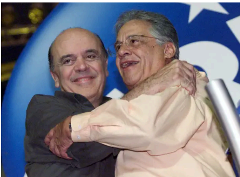
José Serra e FHC durante convenção do PSDB, no ginásio Nilson Nelson, em Brasília, em 2002

A escolha de Serra, no entanto, não foi simples e envolveu diversas disputas partidárias internas. No início do ano eleitoral o PFL (Partido da Frente Liberal), sigla importante em diversos estados em 2002, ainda não estava convencido de que a melhor estratégia era compor ao redor do nome de Serra, as pesquisas de 2º turno eram a principal justificativa. Em razão disso, desde 2001 o partido começou a investir na candidatura de um nome próprio: Roseana Sarney, então Deputada Federal.