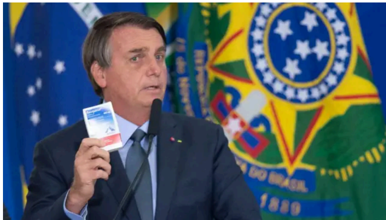
Bolsonaro faz defesa ferrenha de remédio sem comprovação, Cloroquina

tratamentos ineficazes. Até mesmo a vacina, tratada pelo mundo todo como máxima prioridade, foi não só ignorada pelo governante, como ele fez campanha contrária.