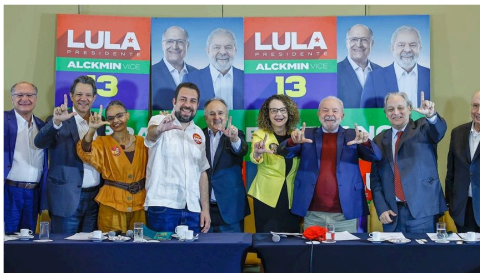
Grupo de ex-presidênciais com Lula

Para isso, a campanha voltou vinte anos depois, a falar de “união” e a trazer o simbolismo de um Brasil unido ao redor de uma mesma ideia. O aspecto novo, trazido pela conjuntura, era a defesa da democracia, muito presente na campanha e principalmente nos discursos proferidos pelos apoiadores não tradicionais, como: Simone Tebet, Geraldo Alckmin, Henrique Meirelles e até mesmo, Fernando Henrique Cardoso.